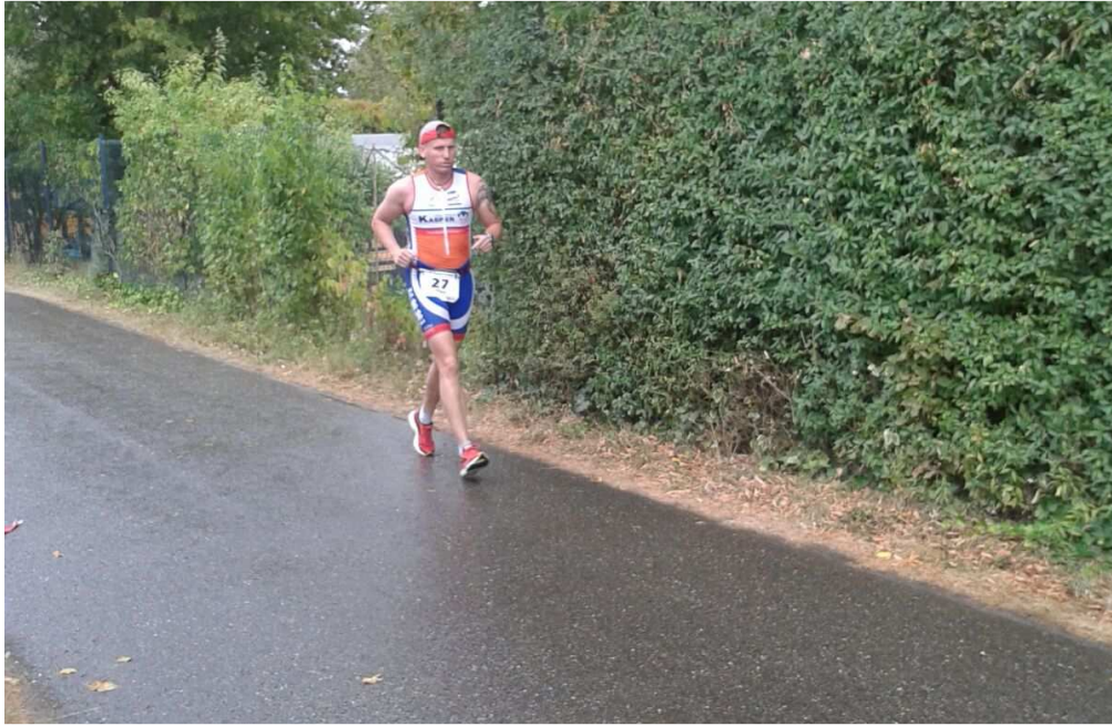
Wiedi on the road