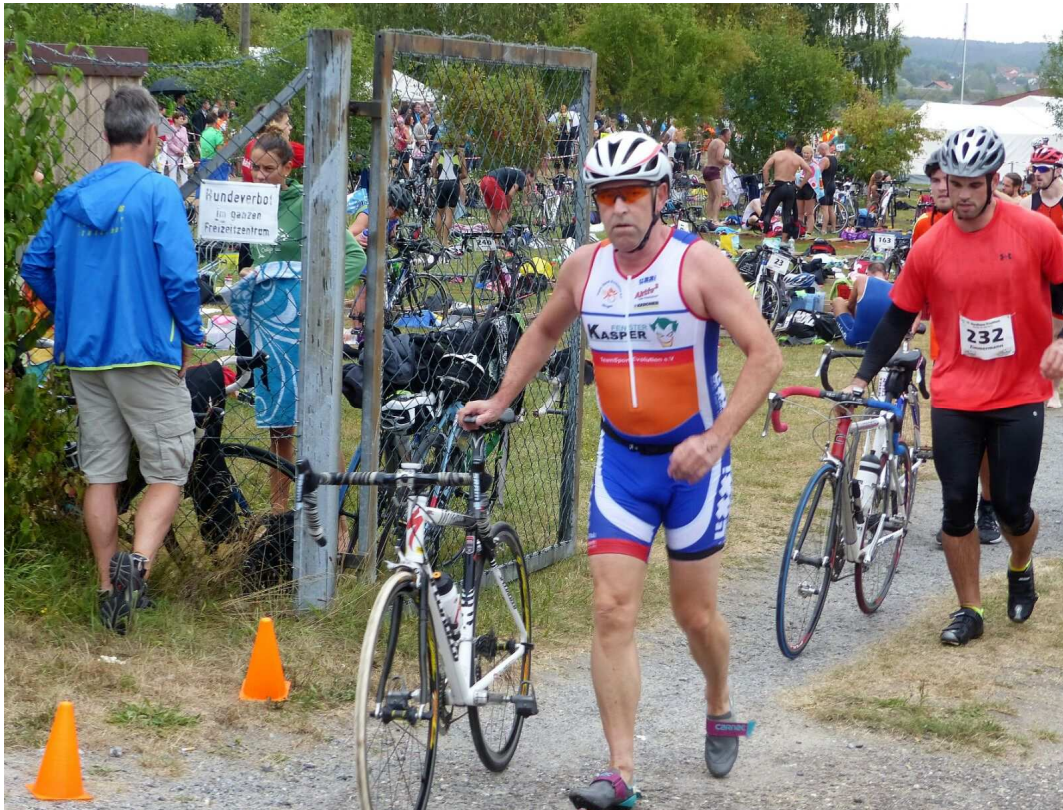
Präsi raus aus dem Neo.....jetzt geht's gleich richtig ab